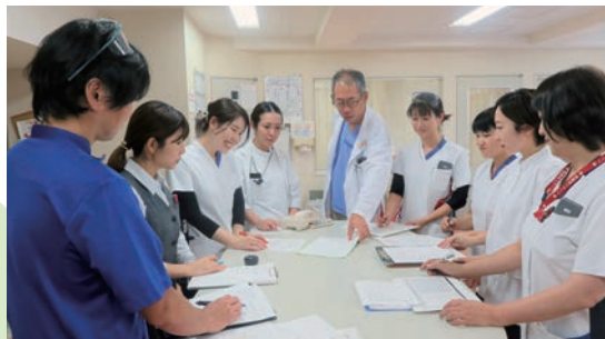
がんサポートチーム(緩和ケアチーム)