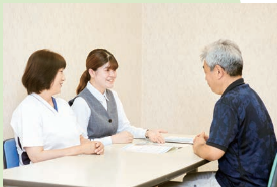
がん相談支援センター

大阪府がん診療拠点病院として、がん診療の質の向上に努め、 地域の方々の健康増進に貢献いたします。