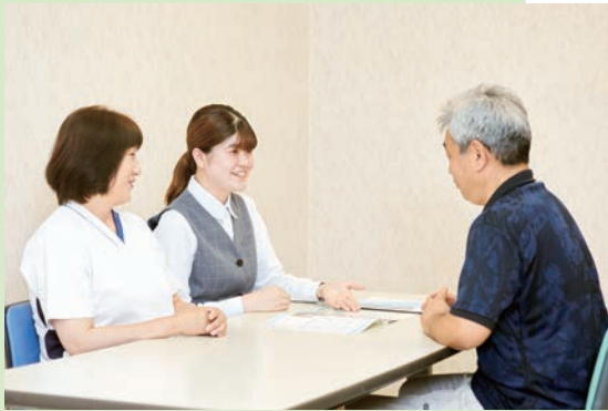
がん相談支援センター

大阪府がん診療拠点病院として、がん診療の質の向上に努め、 地域の方々の健康増進に貢献いたします。