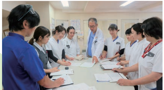
がんサポートチーム(緩和ケアチーム)