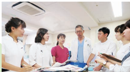
がんサポートチーム(緩和ケアチーム)