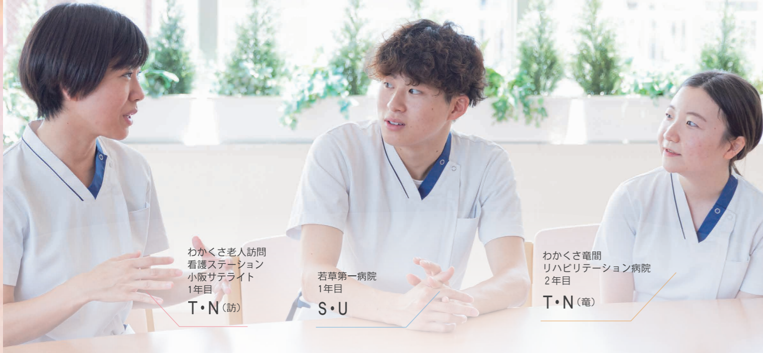
わかかさ老人訪問 看護ステーション 小阪サテライト 1年目 T・N(訪)